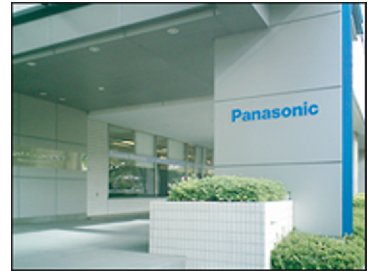
パナソニックコミュニケーションズ株式会社 関東地区 開発プロセス革新グループ

将来的には、このようなアプリケーションが広がると出張先の事業所の方々との予定も調整できるようになって、もっと便利になるかもしれませんね。」